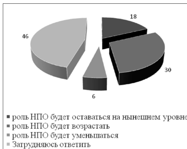
Рис. 3. Представления респондентов о роли и деятельности НПО

Таким образом, по нашему мнению, большинство респондентов плохо информировано о