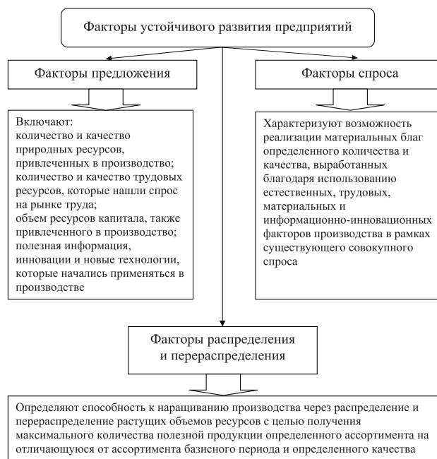
Рис. 1. Классификация факторов устойчивого развития предприятий на основании рыночных категорий спроса и предложения

Именно факторы предложения определяют потенциальную возможность обеспечения экономического роста. Но следует различать способность к росту и реальный рост, сбалансированный, как одна из характеристик устойчивого развития, для чего важными являются две другие группы факторов (факторы спроса, факторы распределения и перераспределения).