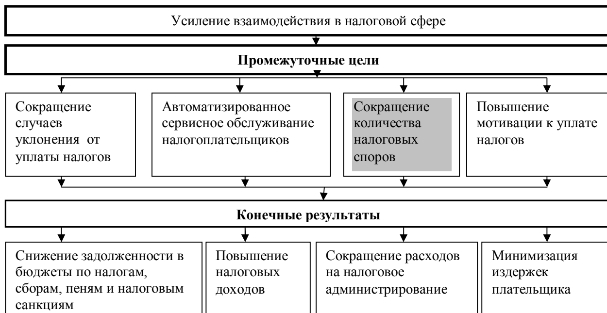
Рис. 1. Промежуточные цели и конечные результаты усиления взаимодействия субъектов налоговых отношений

к мерам в области налоговой политики в 2013 году и плановом периоде 2014 и 2015 годов относилось развитие взаимосогласительных процедур в налоговых отношениях.