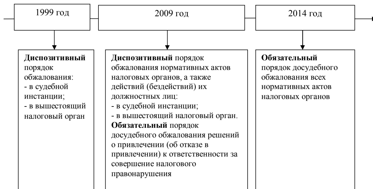
Рис. 3. История развития института урегулирования налоговых споров

Значительную часть жалоб, рассмотренных Федеральной налоговой службой, составляют жалобы, в которых оспорены решения, принятые по результатам камеральных и выездных налоговых проверок.